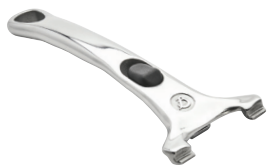
• Poignée amovible 10-366000