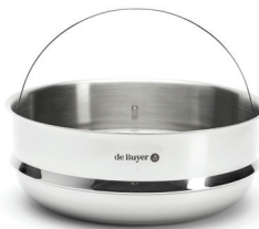
• Passoire cuit-vapeur en acier inoxydable 10-367524 / Ø 24 cm