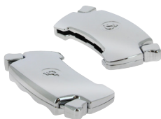
• Lot de 2 anses amovibles verrouillables en métal 10-366003